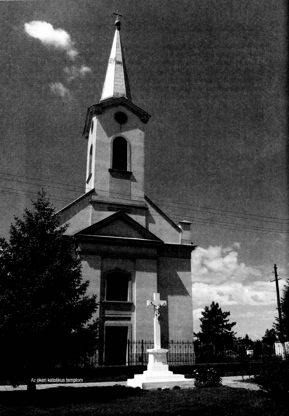
Az ókéri katolikus templom