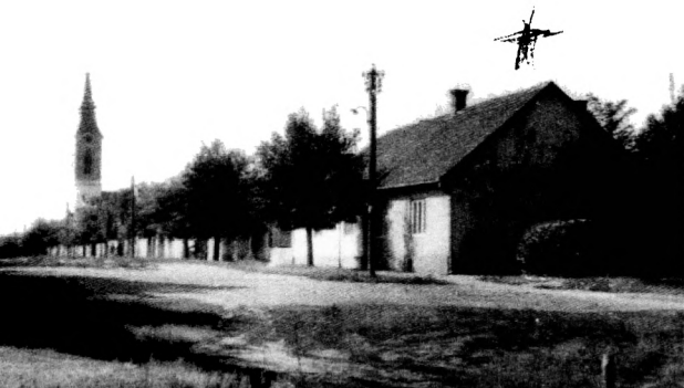
A Lestár család háza Szenttamáson

A kisbíró egyre gyakrabban dobolta: „Lé-giriadó! Bácska, Baja, Pécs...”, jöttek a bombázók. Apám állatokkal kereskedett. Borjúkat vett, és vagonszámra szállította különböző helyekre. Aztán besorozták, azt se tudtuk, merre van.